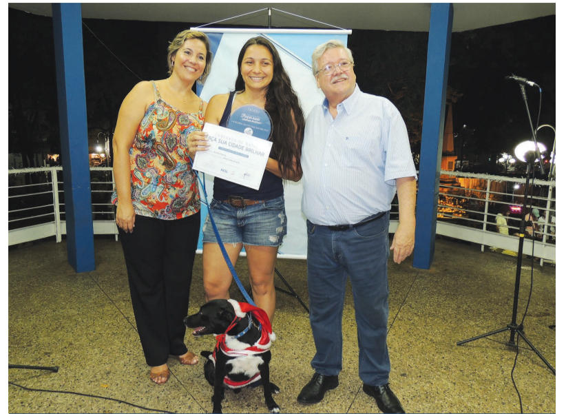
Na categoria Adote uma árvore, a Alpa Limeira ficou em 1º lugar e ganhou troféu e certificado de participação