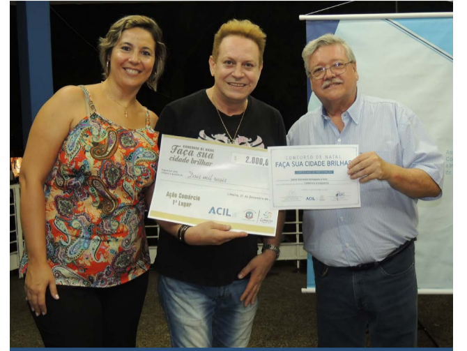
A primeira colocada na categoria Comércio e Indústria foi a Saint Germain Antiquets e Arts, que garantiu o prêmio de R$ 2.000