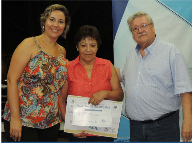
A Xica Magazine garantiu a 3ª colocação e o prêmio de R$ 700