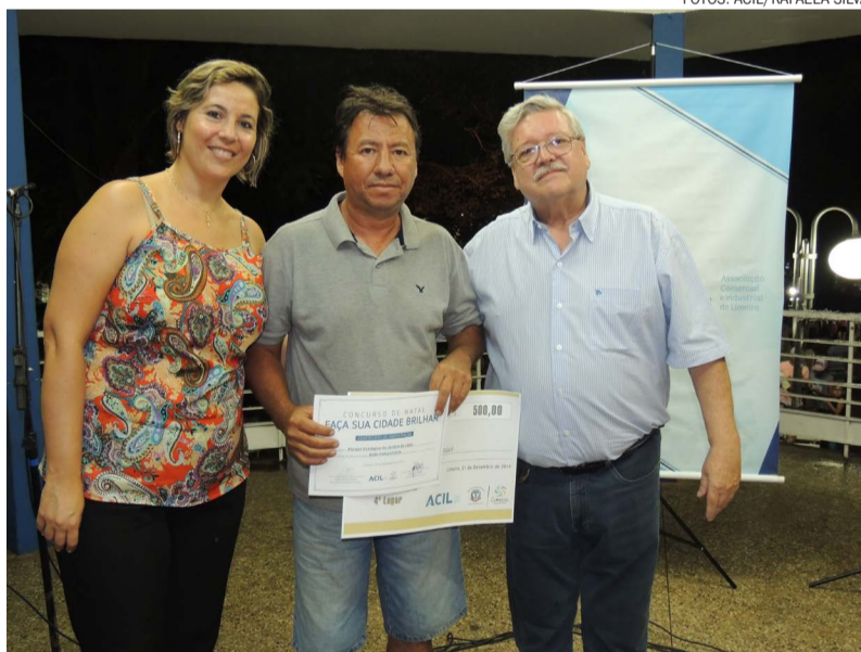
A 4ª colocação ficou com o Parque Ecológico do Jd. do Lago, que levou o prêmio de 500