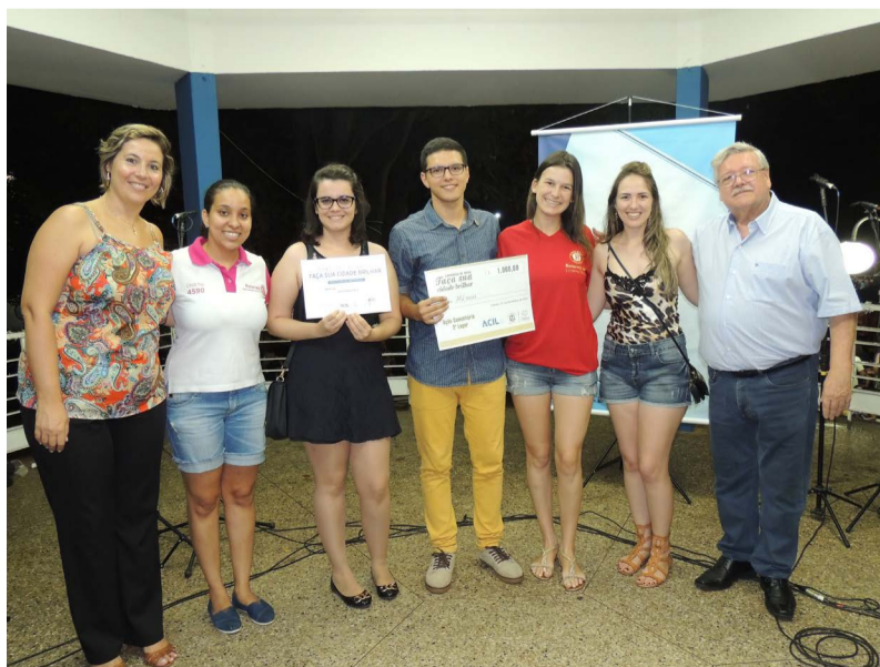
O Nosso Lar foi vice-campeão e garantiu o prêmio de R$ 1.000