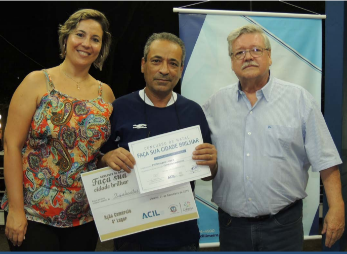
A loja 2 da Pri Mensagens ficou em 4º lugar e ganhou o prêmio de R$ 500