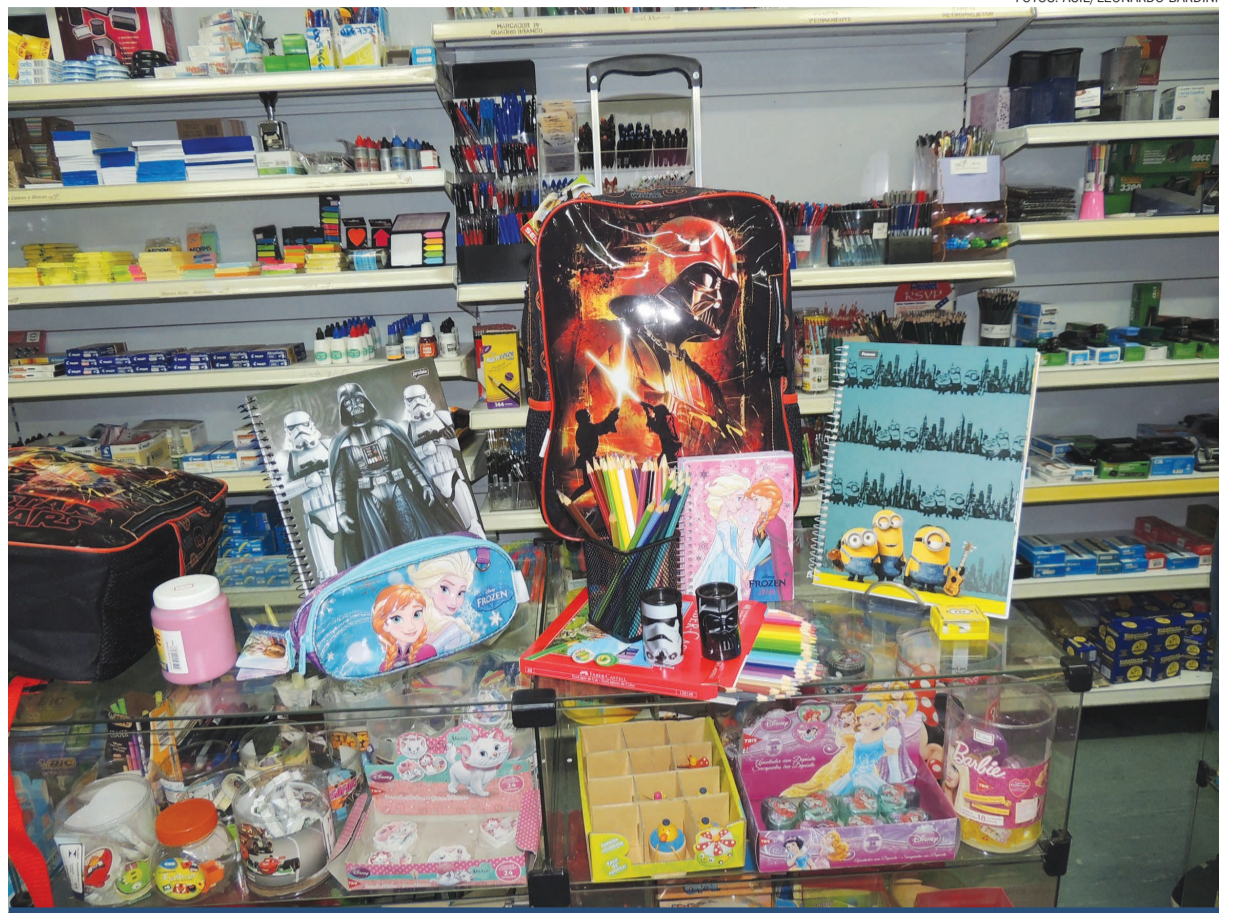
Personagens infantis e de filmes são os preferidos das crianças na hora das compras

O excesso de peso em mochilas é algo que tem levantado discussões. Segundo especialistas uma criança não deve carregar mais que 10% do seu peso. Isto se deve ao fato de que quando ela carrega uma mochila muito