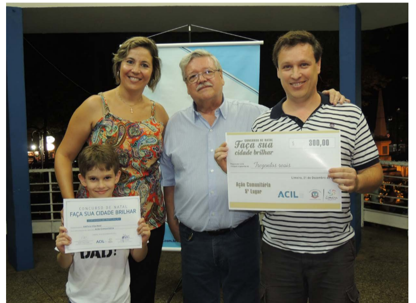
Edifício Vila Real ficou em 5º lugar e ganhou o prêmio de R$ 300