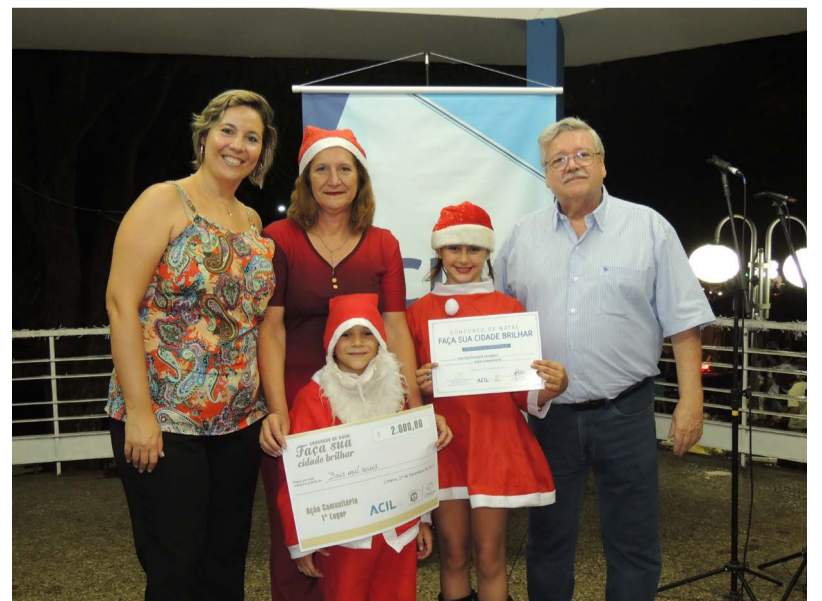
A grande vencedora da categoria Ação Comunitária foi a Praça no Jd Vitória Lucatto, que conquistou o prêmio de R$ 2.000