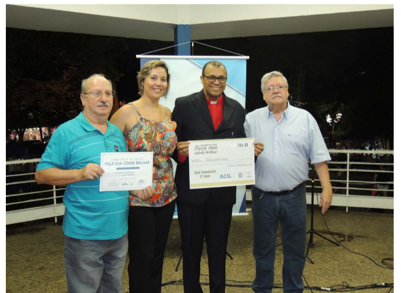
A comunidade Santa Edwiges levou o prêmio de R$ 700 ao conquistar a 3ª colocação