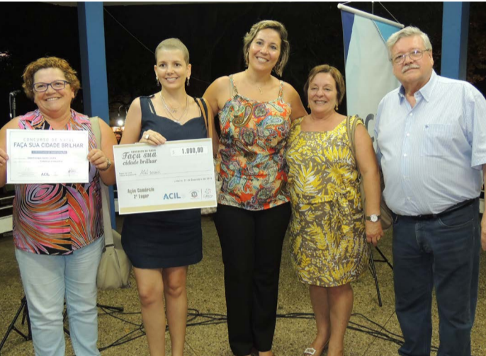
O 2º lugar foi para a Odontologia Santa Josefa, que conquistou o prêmio de R$ 1.000